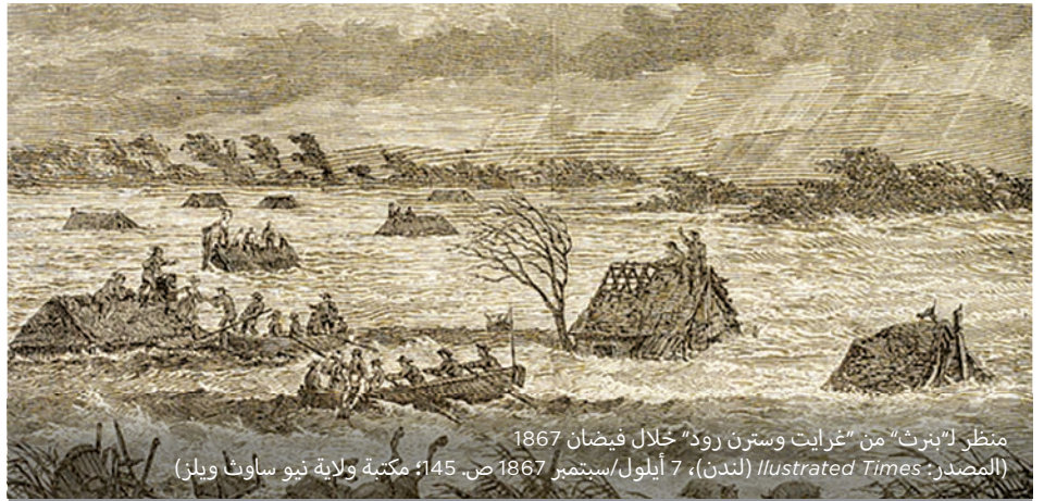
منظر لـ"برث" من "غرايت وسترن رود" خلال فيضان 1867

لقد حصل أكبر فيضان تعيه الذاكرة الحية في تشرين الثاني/نوفمبر من عام 1961، عندما وصل منسوب المياه إلى 14,5 متراً فوق الارتفاع المعتاد لمياه النهر في "ونزر". خلال هذا الفيضان تدمر نادي "نيبيان" للتجديف والزوارق السريعة"، وانقلب جسر "يارامندي" رأساً على عقب وحصل دمار واسع في أنحاء وادي "هوكسبري-نيبيان".