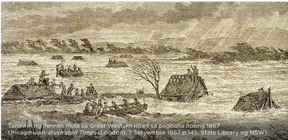
Tanawin ng Penrith mula sa Great Western Road sa pagbaha noong 1867

Ang malalaking pagbaha ay hindi madalas mangyari, ngunit kapag nangyari, may napakalaking mga epekto ito sa komunidad.